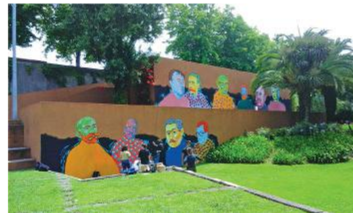
Mural executado por alunos do Centro Artístico - A Casa ao Lado