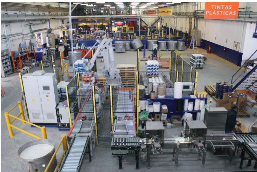
Área de produção

A área de produção é composta por 3 secções distintas: tintas plásticas, esmaltes e vernizes.