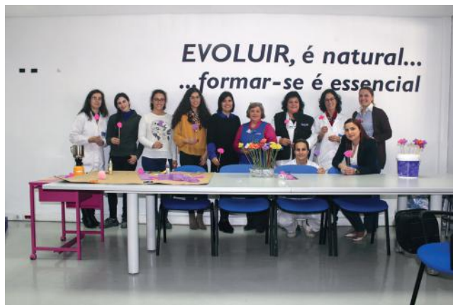
Wokshop Flores de Papel