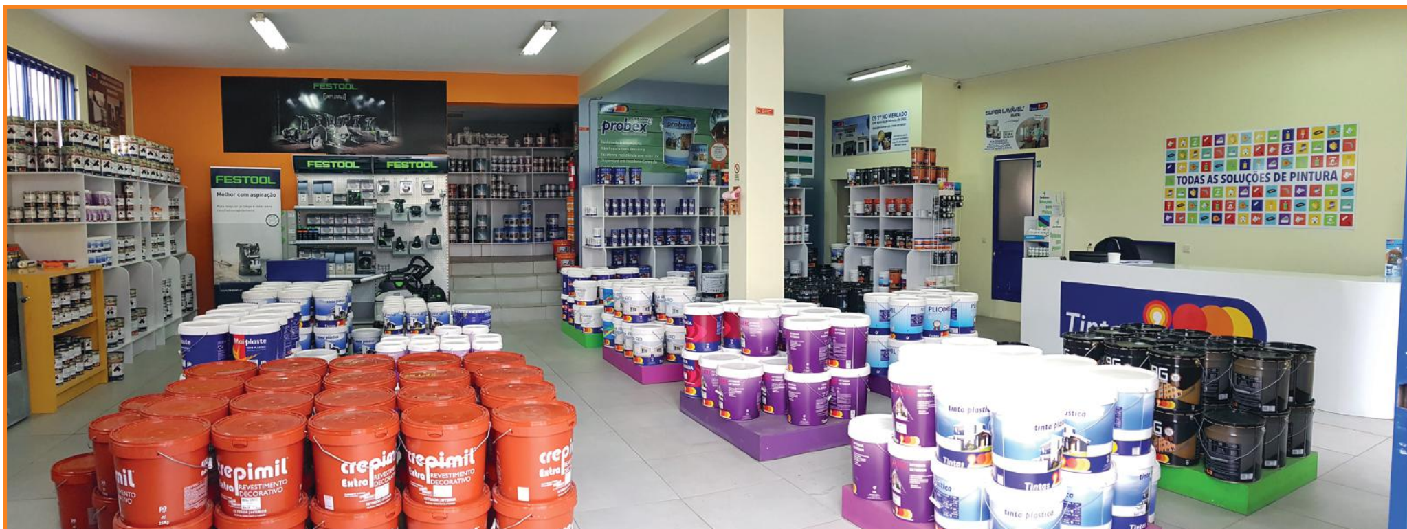
Interior da loja de Palmeira

Todas as lojas possuem um vasto portfólio de produtos e acessórios de pintura que, aliados às sugestões e conhecimentos dos nossos colaboradores, ajudam a encontrar solução ideal para o que pretende. Todas as lojas estão ainda equipadas com sistema de afinação automático - 2000 Mix - que permite afinar mais de 10 000 cores no momento, entre cores leves, médias e fortes.