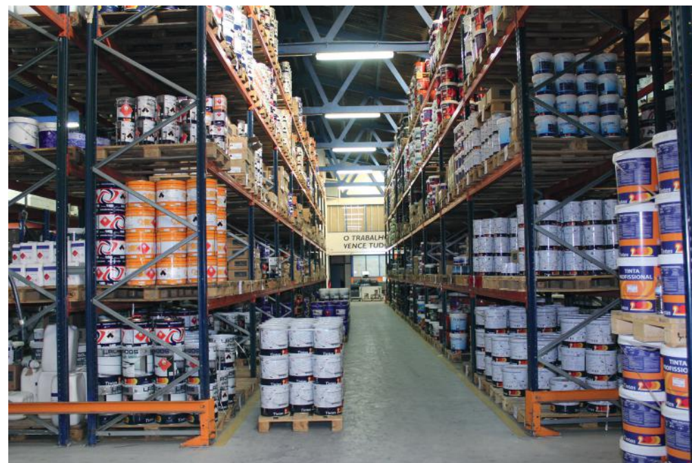
Armazém de Produto Acabado

Nos últimos anos foram feitos vários investimentos na produção, aumentando inclusivamente a área produtiva bem como a nossa capacidade produtiva para 15 000 toneladas /ano.