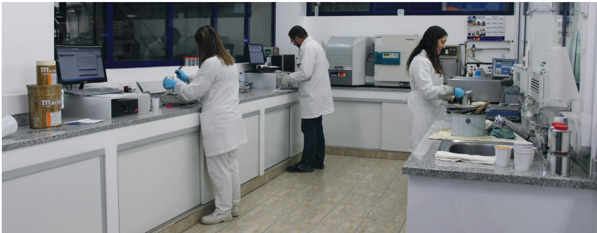
Laboratório de Controlo da Qualidade

A Fábrica de Tintas 2000, S.A. é uma empresa certificada, desde 1995, pela ISO 9001:2015 - Sistemas de Gestão da Qualidade: Requisitos.