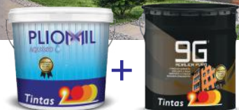
Primário Pliomil Aquoso